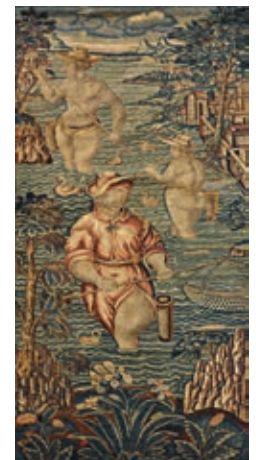
344. TAPISSERIE formant portière La pêche , XVIII e siècle 253 x 107 cm 1.500 / 2.000 €