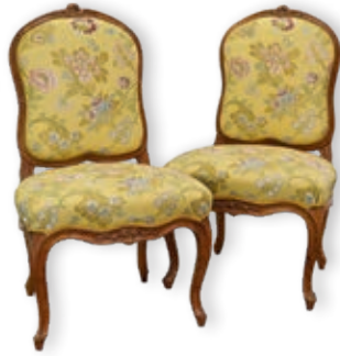
317. Paire de CHAISES BASSES en bois sculpté - Estampillées P. REMY Époque Louis XV - H.: 94.5 cm Pierre REMY, reçu maître en 1750 à Paris 400 / 500 €