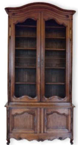
371. BUFFET DEUX CORPS formant BIBLIOTHÈQUE en bois naturel, deux portes grillagées, belle traverse chantournée XVIII e siècle H.: 286 cm - l.: 152 cm P.: 58 cm 1.000 / 1.500 €