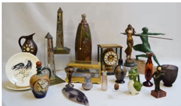
Art Nouveau, Art Déco