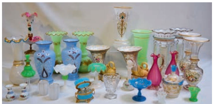
Important ensemble d'opalines

CATALOGUE complet en ligne sur : www.interencheres.com/44003 - www.ivoire-nantes.fr