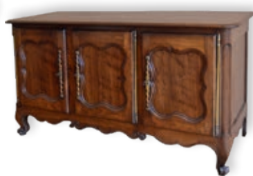
331. BUFFET BAS NANTAIS en acajou ouvrant à trois portes Travail de port, Nantes, XVIII e siècle H.: 98 cm - l.: 174 cm - P.: 65.5 cm 1.000 / 1.500 €