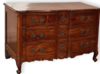
333. COMMODE NANTAISE en acajou, trois tiroirs, façade à double arbalète Travail de port, Nantes, XVIII e siècle H.: 91.5 cm - l.: 138 cm - P.: 62.5 cm 1.500 / 2.000 €