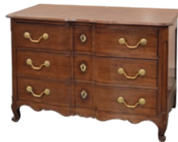
361. COMMODE NANTAISE en acajou ouvrant à trois tiroirs, la façade de forme arbalète Travail de port, Nantes, XVIII e siècle H.: 82 cm - l.: 117 cm - P.: 64 cm 1.500 / 2.000 €