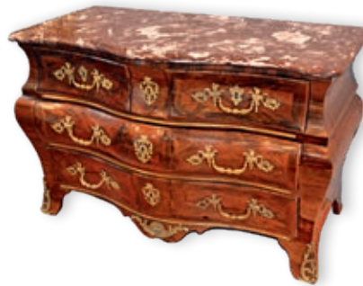
318. COMMODE EN TOMBEAU en bois de placage, dessus de marbre Époque Louis XV H.: 83.5 cm - l.: 134 cm - P.: 68 cm 3.000 / 4.000 €