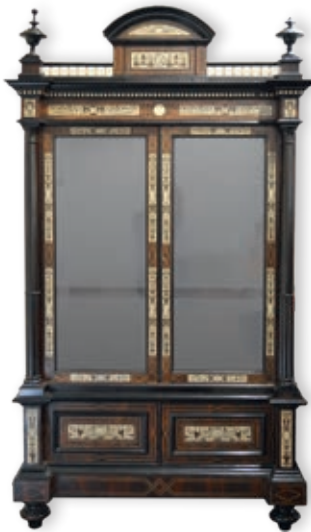
310. BIBLIOTHÈQUE en bois noirci avec incrustations d'os Travail néo-Renaissance du XIX e siècle H.: 234 cm - l.: 131 cm - P.: 50 cm 1.000 / 1.500 €