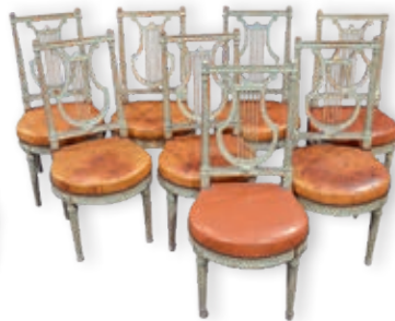
345. Suite de huit CHAISES en bois sculpté, dossier en forme de lyre Style Louis XVI, attribuées à la Maison Jansen H.: 88 cm 500 / 800 €