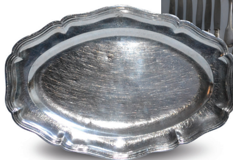
513. PLAT ovale en argent, modèle filets, Paris 1788 600 / 800 €