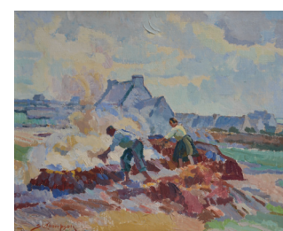
115. SYDNEY THOMPSON Les bruleurs de goémon Toile signée. 50 x 61 cm D'un ensemble de onze œuvres 1.500 / 2.000 €