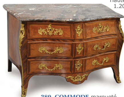
280. COMMODE marqueté, estampillé Schlichtig. Epoque Louis XV 87 x 134 x 61 cm 3.000 / 4.000 €