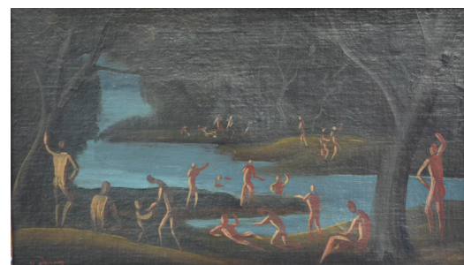
110. ANDRÉ DERAÏN Baigneuses Toile signée 24 x 41 cm 6.000 / 8.000 €