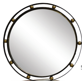
200. JEAN ROYERE Miroir circulaire, métal peint Diamètre 67.5 cm 5.000 / 6.000 €