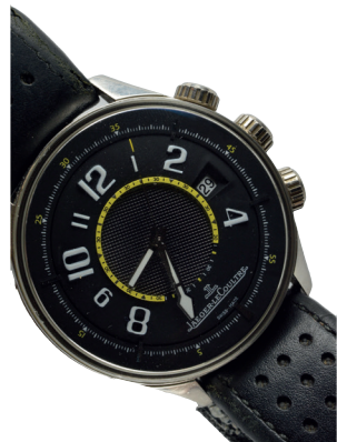
671. JAEGER LECOULTRE ASTON MARTIN AMOX 1 RACING - Limited Edition Boîtier en platine ref 191.6.97, diam 44 mm 5.000 / 6.000 €