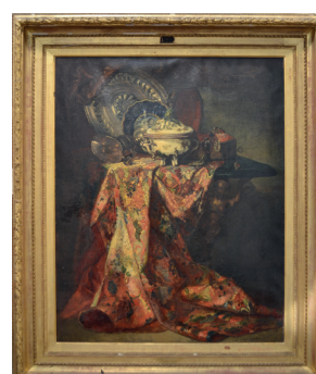
45. CHARLES MONGINOT Nature morte au tapis Toile signée 163 x 132 cm 2.000 / 3.000 €