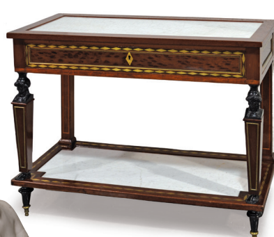
330. CONSOLE en acajou, montant cariatides Début XIX ème siècle 87 x 107 x 45.5 cm 1.000 / 1.200 €