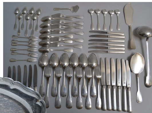
580. RAVINET D'ENFERT & CIE Ménagère en argent, modèle uniplat coquille, comprenant soixante-trois pièces : Minerve. Poids net : 2kg390 1.000 / 1.500 €