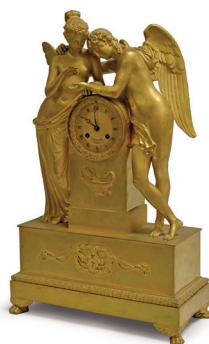
240. PENDULE bronze doré, Psyché et amour Epoque restauration Hauteur : 57.5 cm 1.200 / 1.500 €