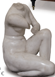
260. ECOLE FRANÇAISE DU XIX ÈME SIÈCLE, D'APRÈS L'ANTIQUE Vénus accroupie Marbre blanc, H. : 57 cm 3.000 / 4.000 €