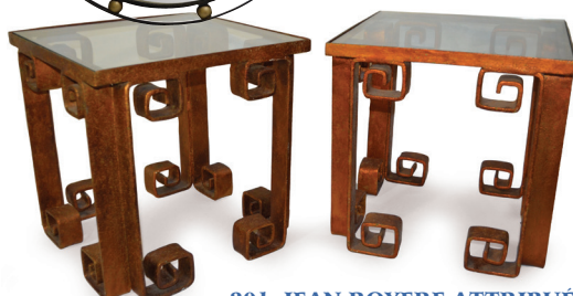
201. JEAN ROYERE ATTRIBUÉ À Paire de tables, bouts de canapé, fer forgé patine dorée. Modèle Pékin. 45 x 45 cm 8.000 / 10.000 €