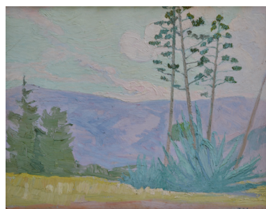
120. KONSTANTINOS MALEAS Grèce, bord de cote Panneau signée 33 x 41.5 cm 5.000 / 6.000 €