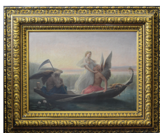
80. HENRI PIERRE PICOU L'amour et le temps Toile signée 75 x 100,5 cm 2.000 / 3.000 €