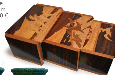
205. GALLE Table gigogne décor d'ours, otaries. Signée 33.5 x 65.5 x 40 cm 2.000 / 3.000 €