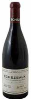
1B Echézeaux , Domaine de la Romanée Conti 2001 1.000 / 1.500 €