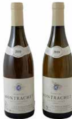
2B Montrachet , Grand cru, Romanet, 2010 1.800 / 2.200 €