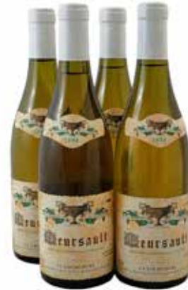
4B Meursault , Coche-Dury, 1998 1.500 / 2.000 €