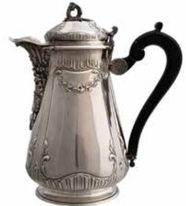
CHOCOLATIERE en argent par Edmond TETARD. Minerve H. 22.5 cm, 680 gr 250 / 300 €