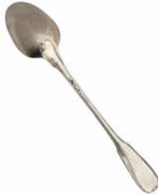
CUILLERE A POT en argent Paris, 1775 L. 36.5 cm, 234 gr 300 / 400 €