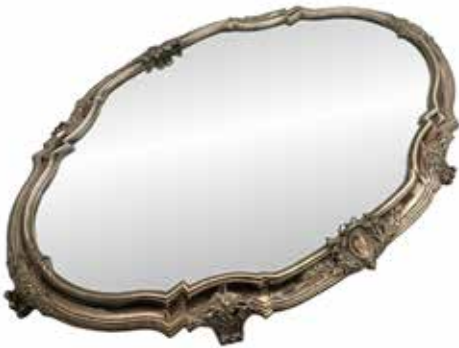
SURTOUT DE TABLE en argent foncé de glace Minerve. 79 x 53 cm 1.500 / 2.000 €